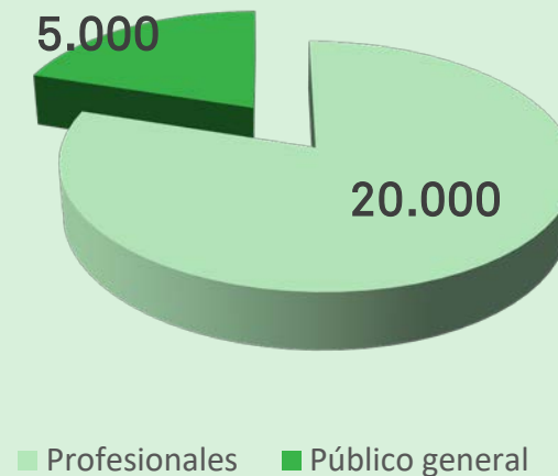
Objetivo EcoSalud 2019

EcoSalud 2019 se marca el objetivo de llegar a los 20.000 visitantes profesionales y que éstos supongan el 80% del total de asistentes.